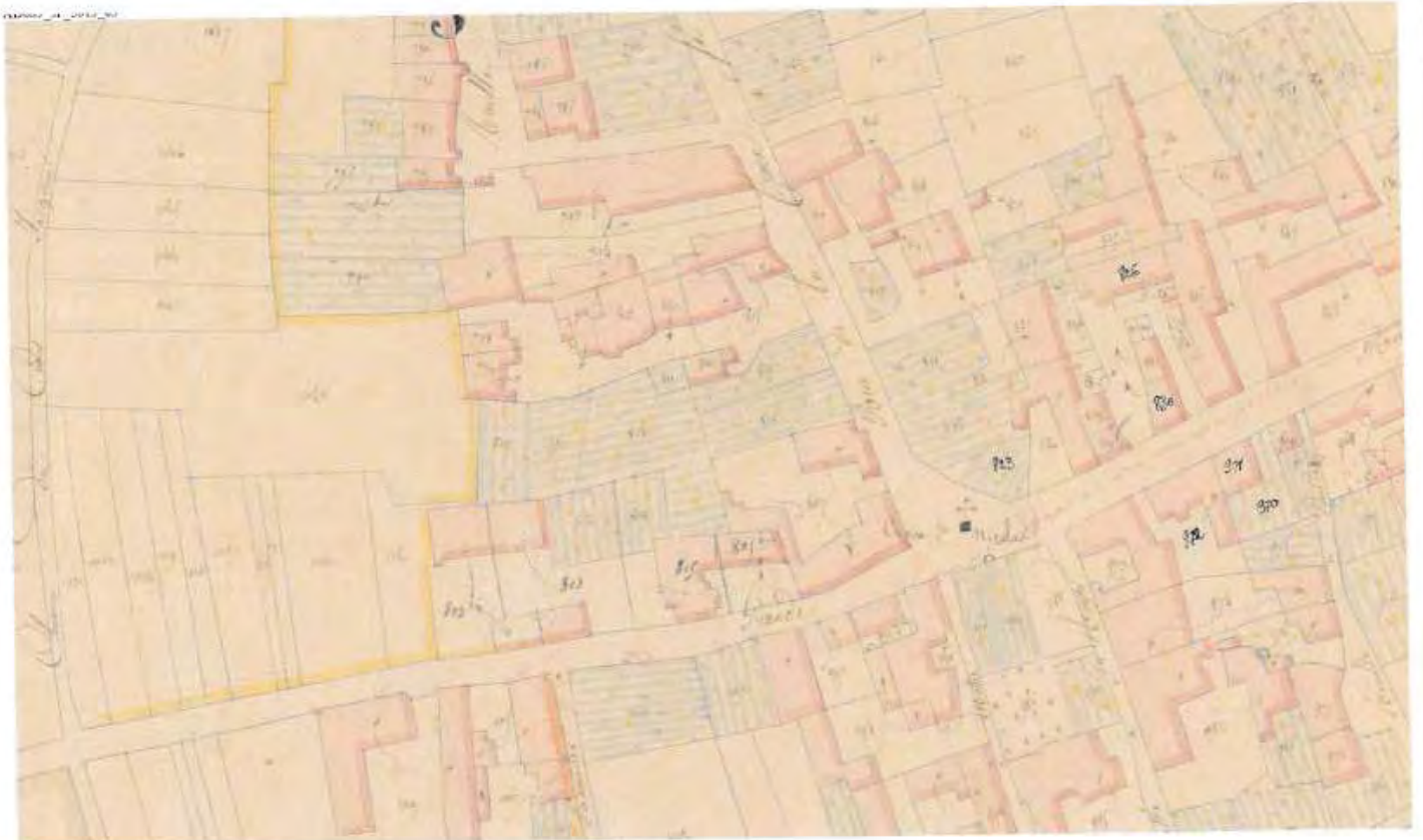
AD082 3P 5813_03 * : 3 P 5813/3 Section A développement du village (1:1250). 1833 tion A développement du village (1:1250). méro de vue : 1 / 1