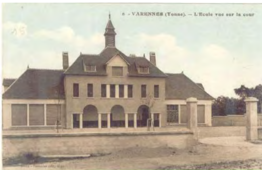
La nouvelle école côté cour

Début 1939 (session du 26 février), les travaux sont en bonne voie : il s'agit maintenant de délibérer pour choisir l'entreprise qui sera chargé de l'installation de la lumière électrique (sic !) : un concours retreint entre spécialistes ayant pour but l'installation de la lumière électrique à l'école de Varennes a été organisé. C'est que l'électricité est chose nouvelle ; l'électrification de Varennes n'est intervenue qu'une décennie plus tôt à peine ! L'entreprise Bornhauser est retenue pour un montant de 6 620 francs.